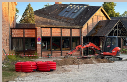
Tranchée câbles électriques

Votre soutien demeure indispensable pour mener à bien les chantiers nécessaires à la poursuite de notre activité. En effet, comme vous le savez, les tarifs journaliers proposés à nos retraitants couvrent uniquement les frais de fonctionnement courants de notre centre.