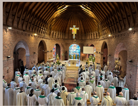
Session de prêtres