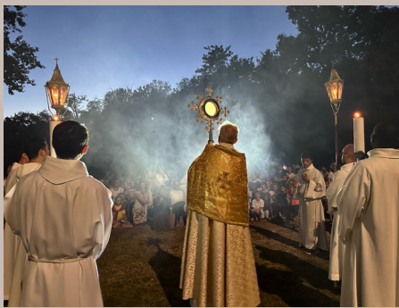
Festival Open Heaven