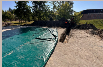
Création d'une DECI